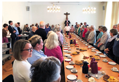
Vor dem Kaffee ein gemeinsamer Kanon