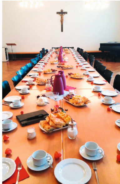
Die Tafel ist reich gedeckt

Das Presbyterium berichtete über aktuelle laufende Projekte und Herausforderungen: